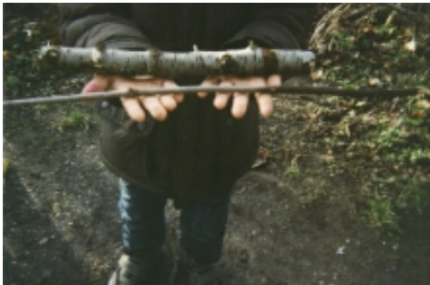
Foto taget af børnene selv under kunstprojektet De Hemmelige Huler , 2012

Udover at sikre kunstneren et minimumshonorar på 20.000 kr., sikrer Huskunstnerordningen altså også, at undervisningen sker på kunstens præmisser.