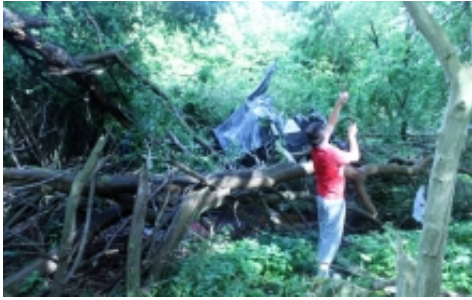
Foto taget under lydoptagelserne til teaterforestillingen Vi ses, Rafiq-e-man , 2015

Carsten Friberg, søsat kunstprojektet Laboratoriet for Vadehavets Ånd , som vil indgå i programmet for festivalen Vadehavsfestival i 2016.