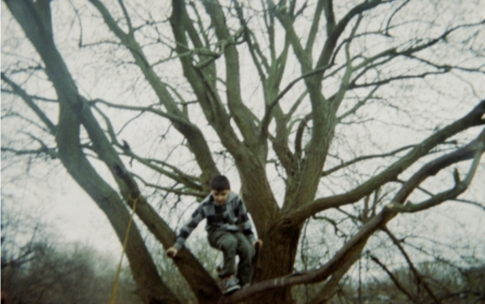
Foto taget af børnene selv under kunstprojektet De Hemmelige Huler , 2012