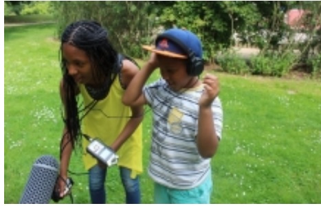
Foto taget under lydoptagelserne til teaterforestillingen Vi ses, Rafiq-e-man , 2015