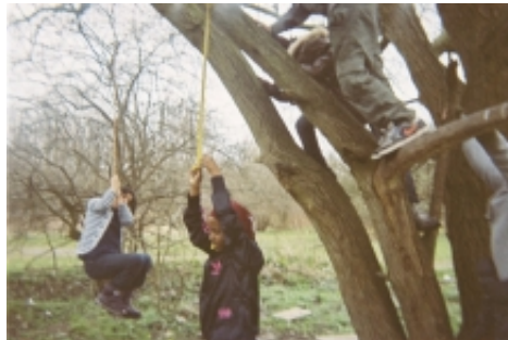
Foto taget af børnene selv under kunstprojektet De Hemmelige Huler , 2012